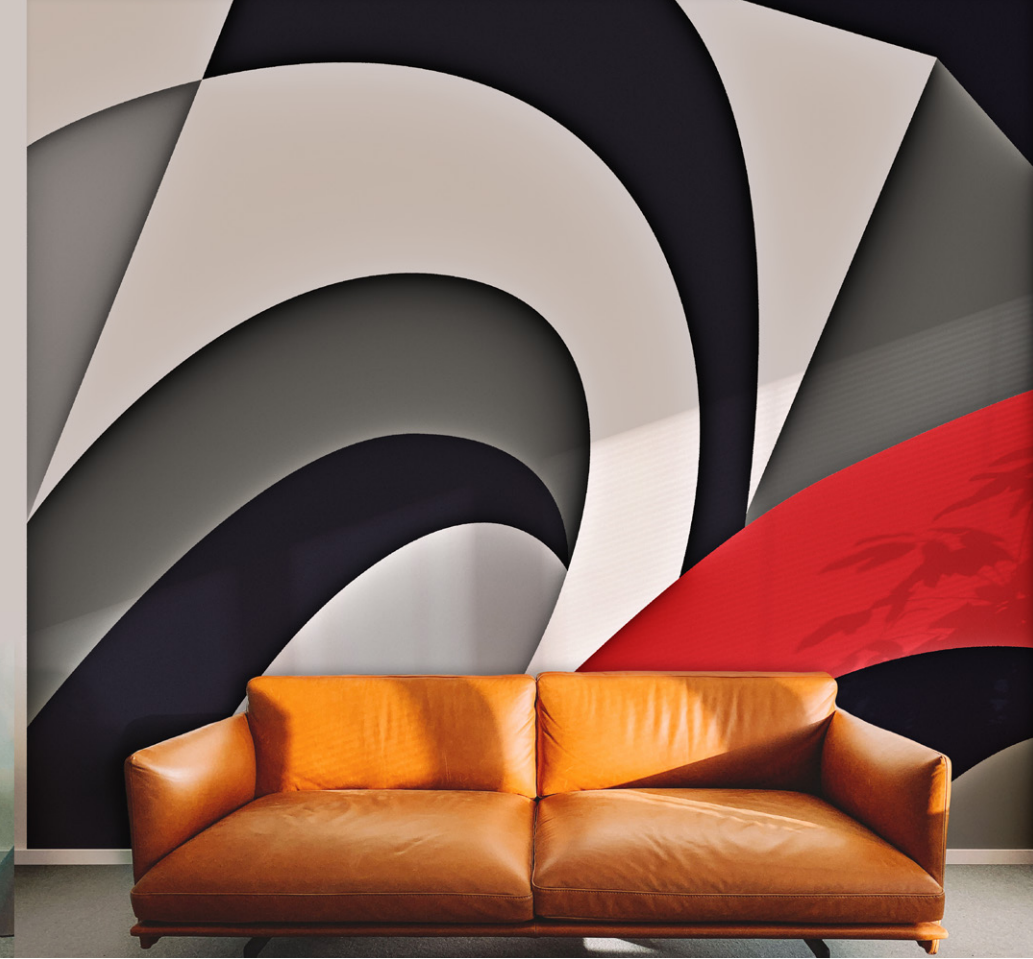
VIA ROMA ROMA STREET